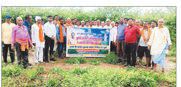
शैक्षणिक भ्रमण करते किसान।

जशपुरनगर। जिले में कृषि क्रांति अभियान अंतर्गत मुख्यमंत्री विष्णुदेव साय द्वारा हरी झंडी दिखा कर किसानों को शैक्षणिक भ्रमण पर भेजा गया है। भ्रमण में किसान रायपुर कृषि महाविद्यालय के टि.सु. कल्चर लैब में टि.सु. कल्चर की गुणवत्ता एवं विशेषता के बारे में तथा वी.एन.आर.सी.एस. प्राइवेट लिमिटेड रायपुर में विभिन्न फसलों के उन्नत बीजों के उत्पादन तकनीक, उनके उत्पादन क्षमता, कीट रोग के प्रति प्रतिरोधकता इत्यादि की जानकारी ले रहे हैं। साथ ही रायपुर के इंडस मेगा फूड पार्क में विभिन्न फसलों के प्रसंस्करण के कई कार्यक्रमों एवं प्रसंस्करण के उपरान्त फसल के मूल्य एवं जीवनकाल में वृद्धि से बाजार मूल्य में वृद्धि की तकनीकी जानकारी प्राप्त कर रहे हैं। जिले के किसान कृषि विभाग अंतर्गत आरामा प्रोजेक्ट एवं कृषि क्रांति अभियान अंतर्गत शैक्षणिक भ्रमण में पाए हैं जो किसान कुशल-कासाबल एवं कुनकुरी के उन्नतशील कृषक एवं पकपीओ के सदस्य हैं।