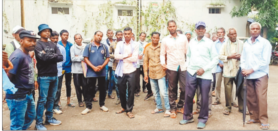
उचित मुआवजे की मांग के लिए कलेक्टरेट पहुंचे किसान।

किसानों का कहना है कि उनकी जमीन के बदले में जो राशि सरकार से मिल रही है, उससे वे दूसरी जमीन नहीं खरीद पा रहे हैं। ऐसे में वे भूमिहीन हो कर बेरोजगार व भूखमरी का शिकार हो जाएंगे।