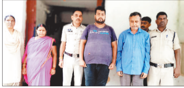
पुलिस गिरफ्तार में टगों के आरोपी।

टगों के मामलों पर अंकुश लगाने पुलिस का विशेष अभियान ऑपरेशन अंकुश लगाता परिणाम दे रहा है। इसी कड़ी में पुलिस ने टगों के एक पुराने प्रकरण में तीन फरार आरोपियों को अंबिकापुर से गिरफ्तार कर न्यायिक रिमांड पर जेल भेज दिया है। पकड़े गए आरोपियों में एक महिला भी शामिल है। जबकि एक आरोपी अब भी पुलिस की पकड़ से बाहर है, जिसकी तलाश जारी है।