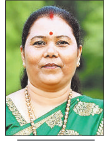
■ 15 करोड़ 91 लाख रूपये स्वीकृत

भवन निर्माण हेतु कुल 15 करोड़ 91 लाख रुपये की स्वीकृति मिली है। नए भवन निर्माण में पोस्ट मैट्रिक अनुसूचित जनजाति बालक छात्रावास कांसाबेल 2 करोड़ 89 लाख, पोस्ट मैट्रिक अनुसूचित जनजाति बालक छात्रावास दोकड़ा 1 करोड़ 92 लाख, प्री मैट्रिक अनुसूचित जनजाति बालक छात्रावास कांसाबेल 1 करोड़ 53 लाख, प्री मैट्रिक अनुसूचित जनजाति बालक छात्रावास बटाईकेला 1 करोड़ 53 लाख, प्री मैट्रिक अनुसूचित जनजाति बालक छात्रावास दोकड़ा 1 करोड़ 53 लाख, पोस्ट मैट्रिक अनुसूचित जनजाति बालक छात्रावास कोतबा 1 करोड़ 92 लाख, प्री मैट्रिक अनुसूचित जनजाति बालक छात्रावास लोदाम 1 करोड़ 53 लाख, प्री मैट्रिक अनुसूचित जनजाति बालक छात्रावास बागबहार 1 करोड़ 53 लाख, प्री मैट्रिक अनुसूचित जनजाति बालक छात्रावास गाला 1 करोड़ 53 लाख शामिल है। जिसका निर्माण कार्य जल्द शुरू होगा।